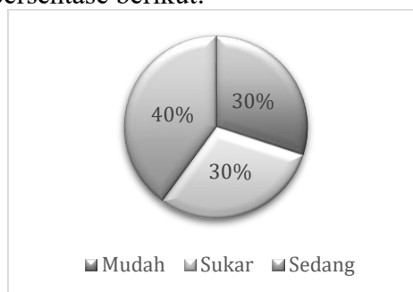
Gambar 1. Diagram Persentase Tingkat Kesukaran Butir Soal

Uji tingkat kesukaraan butir soal untuk mengetahui rata-rata skor butir soal dan dilanjutkan dengan perhitungan tingkat kesukaran butir soal. Hasil uji tingkat kesukaran dari 10 soal pilihan ganda tersebut dapat dilihat dalam bentuk diagram lingkaran yang berupa persentase berikut: