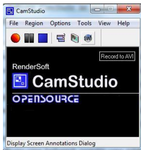
Gambar 1. Tampilan Awal Cam Studio

pembuatan video tutorial atau video pembelajaran. Selain itu, Cam Studio memiliki fitur tambahan yang dapat digunakan untuk mengkonversi file berformat AVI hasil rekamannya ke format Streaming Flash videos (SWFs). Software Cam Studio ini sangat mudah untuk digunakan, dan fiturnya cukup lengkap.