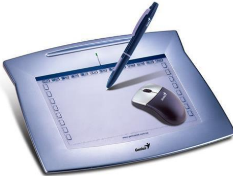
Gambar 2. Pen Tablet / Genius Tablet Mouse Pen 8 x 6

Sebuah tablet grafis terdiri dari tablet digital dan sebuah kursor ataupun sebuah pena digital ( pen ). Tablet digital memiliki permukaan yang pipih sebagai alas gambar yang terdiri atas perlengkapan elektronik yang dapat mendeteksi gerakan kursor atau pena digital kemudian menerjemahkannya menjadi sinyal digital yang dikirim langsung ke komputer. Setiap titik atau gerakan pada tablet merepresentasikan titik atau gerakan pada layer monitor, inilah yang membedakannya dengan fungsi mouse yang tergantung pada letak kursor. Hasil gambar tidak akan terlihat pada tablet itu sendiri, melainkan pada monitor komputer.