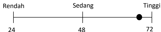
Rating Scale hasil penelitian minat siswa pada pembelajaran himpunan

Jumlah skor ideal (kriterium) jika setiap item mendapat skor tertinggi = 3 \times 4 \times 6 = 72 dan skor terendah jika setiap item diberi skor 1 = 1 \times 4 \times 6 = 24 sedangkan jumlah skor pengumpulan data = 61 berarti kualitas minat siswa pada pembelajaran himpunan menurut 2 orang observer selama 2 siklus (61:72) \times 100\% = 84,7\% dari kriteria yang ditetapkan. Hal ini secara kontinum dapat digambarkan sebagai berikut :