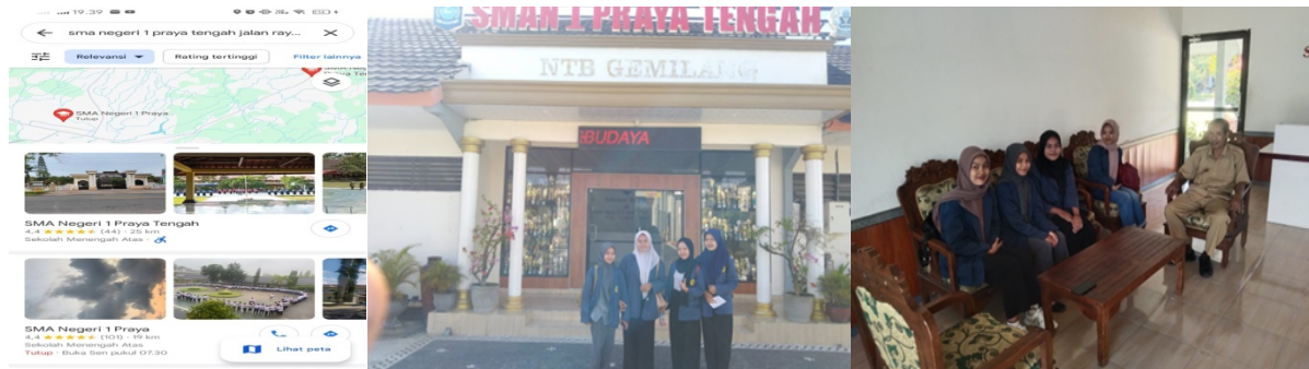
Gambar 1.2.3 Lokasi SMAN 1 Praya Tengah