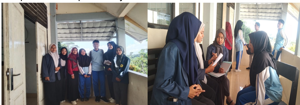
Gambar 4.5 kegiatan sosialisasi

sesi 1 diisi dengan kata-kata pengantar dan pengenalan mengenai media sosial serta menjadi pembukaan dalam kegiatan ini. Sesi 2-3 membahas mengenai media sosial secara mendalam baik dari perannya terhadap perkembangan siswa hingga peran orang tua dan guru dalam mengawasi penggunaan media sosial. Sesi 4-5 diisi dengan tanya jawab. Sesi 4-5 kami melakukan wawancara terkait penggunaan media sosial di sekolah.