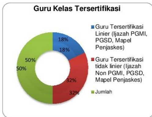
Grafik 1.1 Guru Kelas Tersertifikasi di MI Muhammadiyah Kabupaten Magelang