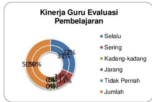
Grafik 1.4 Integrasi Kinerja Guru Evaluasi Pembelajaran Bagi Guru Tersertifikasi

Tabel di atas dapat dijelaskan kondisi kinerja guru tersertifikasi Linieritas Ijazah dan Non Linier Ijazah menunjukkan kinerja yang baik dengan indikator jawaban "Selalu" dan "Sering" pada kisaran 164 skor dengan total prosentase 63 %, maka kinerja guru dalam evaluasi pembelajaran sangat berpengaruh dengan tidak melihat data kualifikasi akademik pada Liner dan Non Linier Ijazah untuk sertifikasi pendidik.