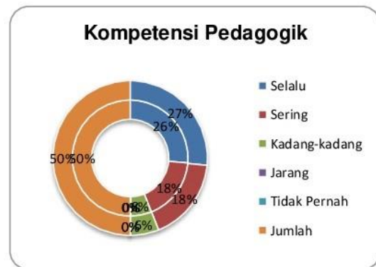
Grafik 1.6 Integrasi Kompetensi Pedagogik Bagi Guru Tersertifikasi

Tabel di atas dapat dijelaskan kondisi kinerja guru tersertifikasi Linieritas Ijazah dan Non Linier Ijazah menunjukkan kinerja yang baik dengan indikator jawaban “Selalu” pada kisaran 137 dengan total prosentase 53 %, maka kinerja guru dalam kompetensi pedagogik sangat berpengaruh dengan tidak melihat data kualifikasi akademik pada Liner