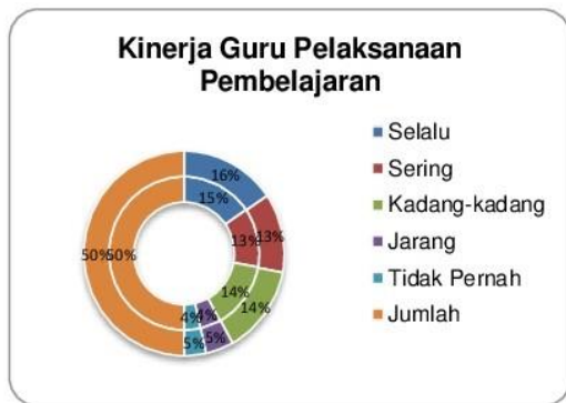
Grafik 1.3 Integrasi Kinerja Guru Pelaksanaan Pembelajaran Bagi Guru Tersertifikasi

Tabel di atas dapat dijelaskan kondisi kinerja guru tersertifikasi Linieritas Ijazah dan Non Linier Ijazah menunjukkan kinerja yang baik dengan indikator jawaban "Selalu" dan "Sering" pada kisaran 164 skor dengan total prosentase 31 %, maka kinerja guru dalam pelaksanaan pembelajaran sangat berpengaruh dengan tidak melihat data kualifikasi akademik pada Liner dan Non Linier Ijazah untuk sertifikasi pendidik.