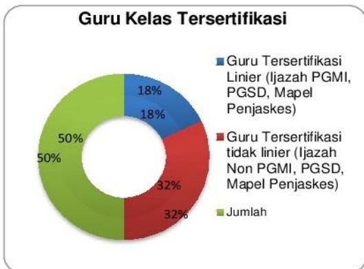
Grafik 1.7 Integrasi Kompetensi Profesional Bagi Guru Tersertifikasi

Dari tabel di atas dapat dijelaskan kondisi kinerja guru tersertifikasi Linieritas Ijazah dan Non Linier Ijazah menunjukkan kinerja yang baik dengan indikator jawaban "Sering" pada kisaran 83 dengan total prosentase 39 %, maka kinerja guru