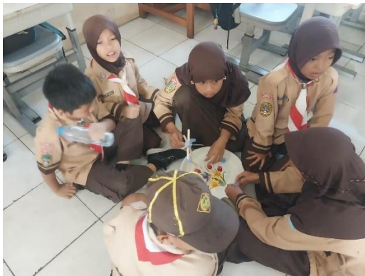
Gambar 2 Proyek Kincir Air pada Siklus I

masih kurang percaya diri dalam menjelaskan hasil proyek kelompoknya di depan kelas. Meskipun demikian, kegiatan proyek kincir air mampu meningkatkan rasa ingin tahu siswa terhadap materi energi sekitar karena siswa dapat mengamati secara langsung perubahan energi yang terjadi pada proyek tersebut.