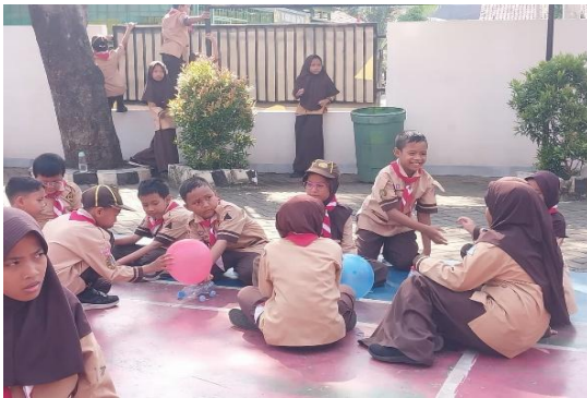
Gambar 3 Proyek Mobil Balon pada Siklus II

Guru dapat memberikan bimbingan secara lebih optimal kepada setiap kelompok sehingga seluruh siswa dapat mengikuti kegiatan pembelajaran dengan baik. Aktivitas siswa yang meningkat pada siklus II menunjukkan bahwa model Project Based Learning mampu menciptakan pembelajaran yang lebih aktif dan bermakna bagi siswa sekolah dasar.