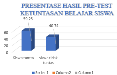
Grafik 2 Presentase Hasil Pretest Ketuntasan Belajar Siswa

Statistik pre-test menunjukkan bahwa 11 siswa memiliki tingkat ketuntasan sebesar 59,25%, sedangkan 16 siswa tidak tuntas, dengan presentase sebesar 40,74% dari total 27 siswa yang berpartisipasi dalam pre-test . Oleh karena itu diperlukan media yang dapat meningkatkan keterampilan membaca siswa, salah satunya melalui media Website Let's Read .