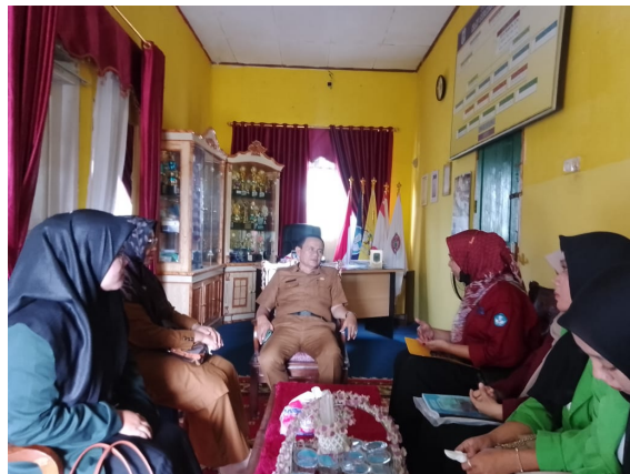
Gambar 1 tahap observasi

Teknik pengumpulan data yang digunakan dalam penelitian ini meliputi observasi, wawancara, dan dokumentasi. Observasi dilakukan untuk mengamati secara langsung proses pembelajaran serta aktivitas literasi dan numerasi di kelas. Wawancara dilakukan kepada guru, siswa, dan mahasiswa untuk memperoleh informasi terkait pelaksanaan program, kendala yang dihadapi, serta dampak yang dirasakan. Dokumentasi digunakan untuk melengkapi data berupa foto kegiatan, catatan pembelajaran, serta dokumen pendukung lainnya.