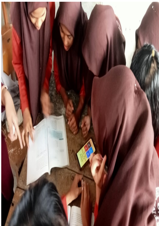
Gambar 6 Numerasi digital

Numerasi digital adalah kemampuan menggunakan teknologi digital untuk memahami, mengolah, dan menyelesaikan permasalahan yang berkaitan dengan angka atau data. Penerapannya tidak hanya terbatas pada perhitungan, tetapi juga mencakup analisis data, interpretasi informasi, serta pengambilan keputusan berbasis teknologi.