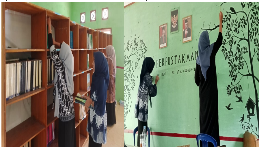
Gambar 4 Penataan Ulang Perpustakaan

untuk memperbarui tampilannya agar lebih menarik. Kegiatan ini bertujuan untuk meningkatkan minat dan bakat siswa dalam mengekspresikan ide serta mendorong seluruh siswa untuk menumbuhkan minat baca melalui pencarian informasi.