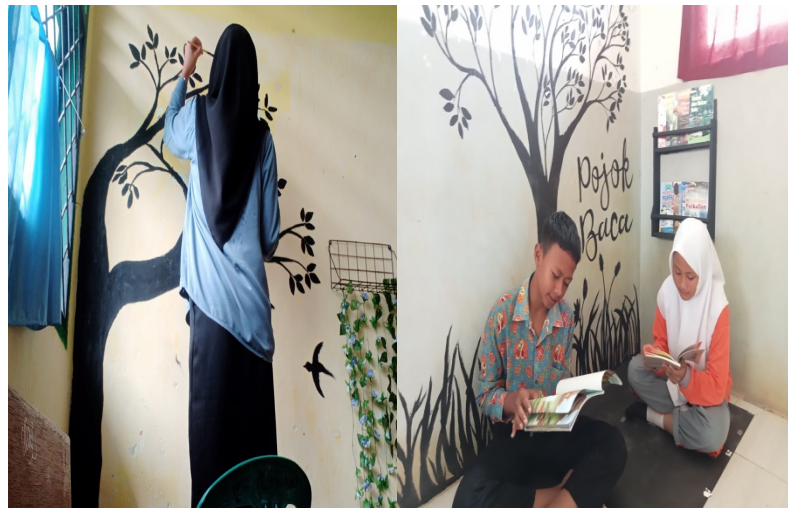
Gambar 2 Pojok baca

Pojok baca adalah suatu tempat yang berada di sudut ruangan dan dilengkapi dengan berbagai koleksi buku. Menurut Kemendikbud (2018), sudut baca merupakan bagian dari ruang kelas yang terletak di pojok ruangan, dilengkapi dengan koleksi buku, serta berfungsi sebagai perpanjangan dari perpustakaan. Menurut (Putrini et al., 2024) Pojok baca adalah area yang memanfaatkan sudut ruang kelas yang dihias dengan lukisan serta tulisan berisi materi atau berbagai poster tertentu. Tujuan utamanya adalah untuk meningkatkan minat baca siswa.