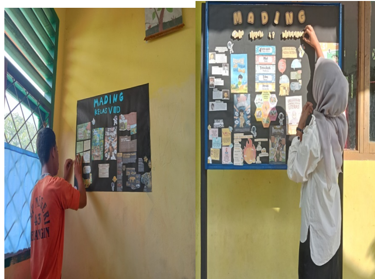
Gambar 3. Mading

Program pembuatan mading atau papan informasi merupakan upaya untuk mengaktifkan kembali mading sekolah sebagai sarana bagi siswa dalam menyalurkan ide dan kreativitasnya. Selain itu, penataan ulang papan informasi dilakukan