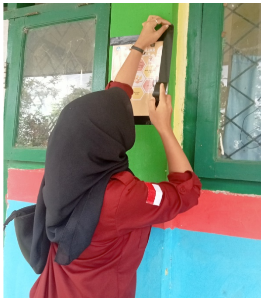
Gambar 5 Poster ajakan baik

penataan yang sistematis memudahkan siswa dan guru dalam mencari serta memanfaatkan koleksi yang tersedia. Penataan ulang juga bertujuan untuk menyesuaikan perpustakaan dengan perkembangan zaman, baik dari segi layanan maupun fasilitas, sehingga mampu memenuhi kebutuhan pemustaka. Dengan demikian, perpustakaan dapat menjadi ruang belajar yang kondusif, efektif, dan menyenangkan bagi seluruh warga sekolah.