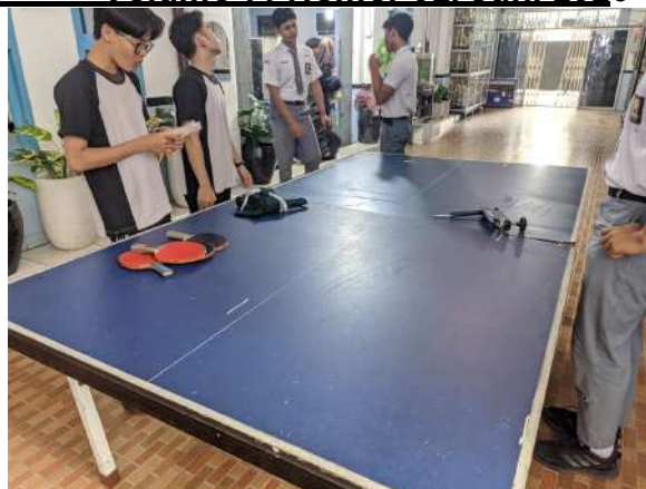
Gambar 4. Kondisi Meja Tenis Meja yang Masih Layak Pakai