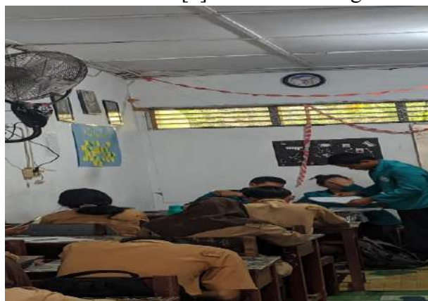
Gambar 2. Pengisian Kuesioner bersama Responden

Kelompok siswa yang menjadi responden adalah siswa yang aktif mengikuti pembelajaran PJOK, khususnya pada materi tenis meja. Sementara itu, guru yang menjadi responden adalah guru mata pelajaran Pendidikan Jasmani, Olahraga, dan Kesehatan yang mengampu kelas-kelas terkait. Jumlah total responden adalah sebanyak [33] orang, terdiri dari [30] siswa dan [3] guru.