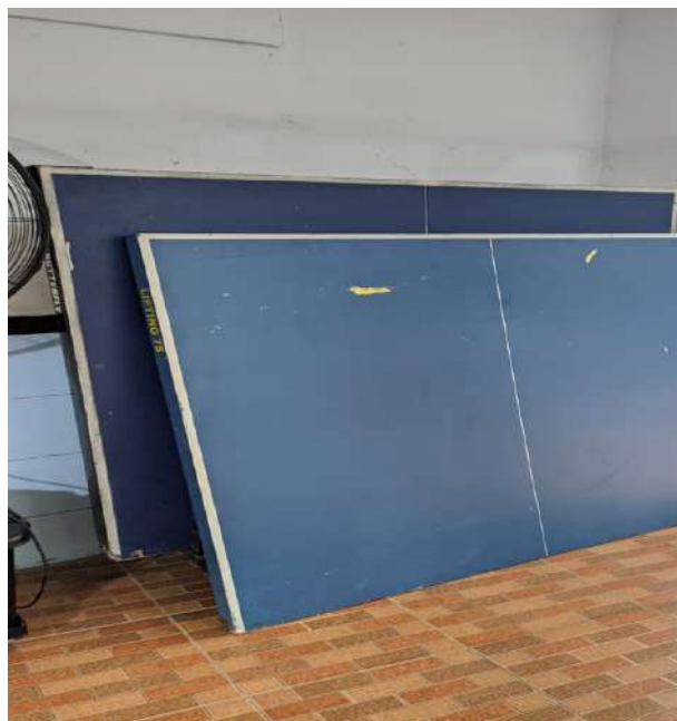
Gambar 3. Kondisi Meja Tenis Meja yang Rusak Berat

Kondisi ini sangat jauh dari standar yang direkomendasikan. International Table Tennis Federation (ITTF, 2024) menetapkan bahwa meja tenis meja yang digunakan untuk keperluan resmi harus memiliki permukaan yang sepenuhnya rata, keras, dan berwarna gelap seragam, dengan nilai pantul minimal 23 cm ketika bola dijatuhkan dari ketinggian 30 cm. Standar ini jelas tidak dapat dipenuhi oleh meja-meja yang ada di SMA Negeri 10 Medan.