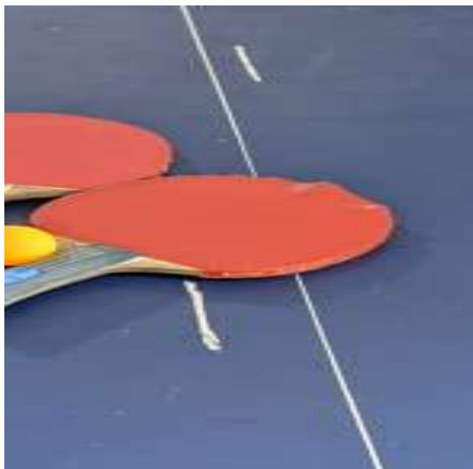
Gambar 5. Kondisi Bet Tenis Meja Tampak Depan dan Belakang

terkontrol. Kondisi bet yang ada di SMA Negeri 10 Medan jelas tidak memenuhi ketentuan ini. Dampaknya bagi pembelajaran adalah ketidakmampuan siswa untuk berlatih teknik dasar tenis meja yang benar, karena respons bola terhadap bet yang rusak menjadi tidak dapat diprediksi.