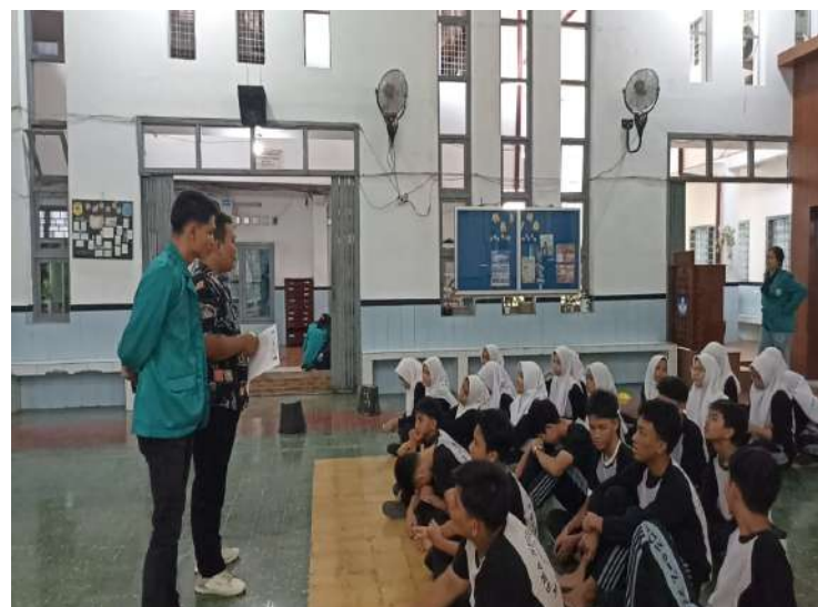
Gambar 1. Suasana Pelaksanaan Kegiatan Penelitian

Seluruh kegiatan tersebut berlangsung secara tertib dan mendapat dukungan penuh dari pihak sekolah.