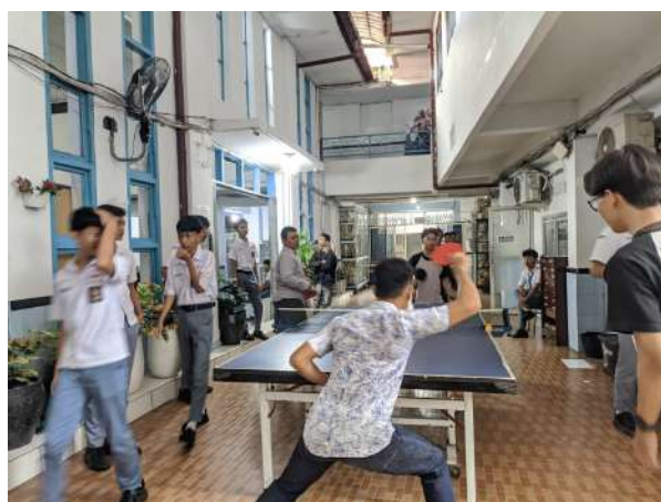
Gambar 12. Aktivitas Siswa dalam Kegiatan Penelitian

Andrianto dan Setiawan (2024) menyatakan bahwa fasilitas olahraga yang tidak memadai secara langsung berkorelasi negatif dengan tingkat motivasi intrinsik siswa dalam mata pelajaran pendidikan jasmani. Temuan ini memperkuat relevansi antara perbaikan sarana prasarana dengan peningkatan kualitas pengalaman belajar siswa.