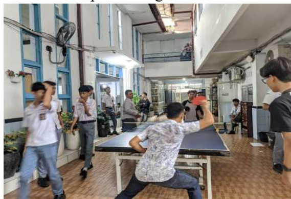
Gambar 13. Kondisi Keseluruhan Area Tenis Meja SMA Negeri 10 Medan