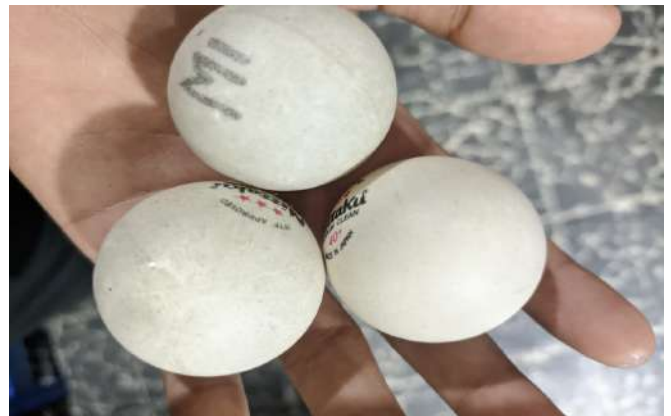
Gambar 6. Kondisi satu Buah Bola Tenis Meja yang Tersedia

Sutarmin (2023) menegaskan bahwa kualitas bola merupakan salah satu faktor determinan dalam akurasi latihan teknik dasar tenis meja, terutama untuk teknik servis dan rally. Penggunaan bola yang rusak atau tidak memenuhi standar secara berkelanjutan dapat menyebabkan siswa mengembangkan kebiasaan gerak yang keliru (bad habits) dalam teknik pukulannya, yang kelak sulit untuk dikoreksi.