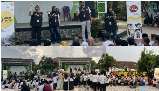
Gambar 3 Kegiatan Pencegahan Kekerasan Seksual di Kampung Literasi Pekijing

merasa terbebani dalam menerima materi yang relatif sensitif.