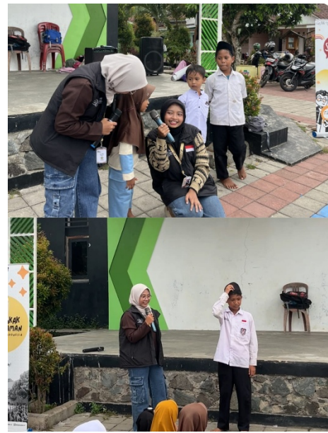
Gambar 2 Foto Sesi Tanya Jawab

Berdasarkan dari tabel tersebut dapat terlihat bahwa terdapat peningkatan pemahaman anak terkait pencegahan kekerasan seksual. Selain itu, terlihat juga dari antusiasme dan partisipasi aktif anak selama kegiatan berlangsung, mulai dari tahap penyampaian materi hingga kegiatan penguatan melalui permainan interaktif. Pada awal kegiatan, sebagian anak masih menunjukkan keterbatasan dalam memahami konsep bagian tubuh pribadi serta belum mampu membedakan sentuhan yang boleh dan tidak boleh dilakukan oleh orang lain. Namun, setelah diberikan edukasi melalui metode dongeng, bernyanyi, dan permainan, terjadi peningkatan pemahaman yang ditunjukkan melalui kemampuan anak dalam menyebutkan bagian tubuh pribadi yang harus di lindungi serta respon yang tepat dalam menjawab pertanyaan terkait situasi berbahaya.