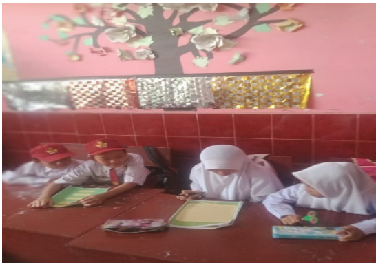
Gambar 1 Dokumentasi Foto Pembelajaran