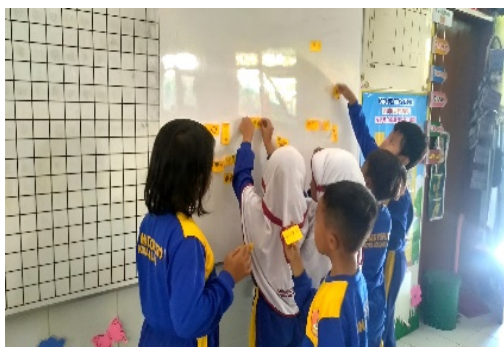
Gambar 1: Siswa menempel dipapan tulis hasil menulis kata dengan media sticky note

Ketiga, metode STAR (Situation, Task, Action, Result) memberikan kerangka kerja yang jelas bagi guru. Seperti diungkap oleh Kadir (2022), STAR membantu guru merancang, melaksanakan, dan mengevaluasi pembelajaran secara lebih terstruktur. Penelitian serupa oleh Sudjalil, Iswatiningsih, dan Pangesti (2024) juga membuktikan bahwa metode ini efektif untuk mendokumentasikan dan membagikan praktik baik pembelajaran. Dalam konteks penelitian ini, metode STAR memungkinkan peneliti untuk: