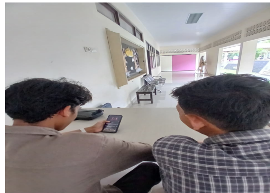
Gambar 2 Mahasiswa Mengamati Unggahan Satire Politik di Instagram