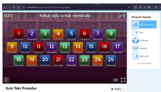
Gambar 1. Tampilan Awal Wordwall template Open The Box

Proses pembelajaran menerapkan media Wordwall dengan template Open the Box yang digunakan dalam 2 siklus. Sebagaimana yang ditunjukkan pada Gambar 1, tampilan awal template Open The Box pada media Wordwall materi teks prosedur. Selanjutnya, Gambar 2, tampilan butir soal saat salah satu kotak dibuka.