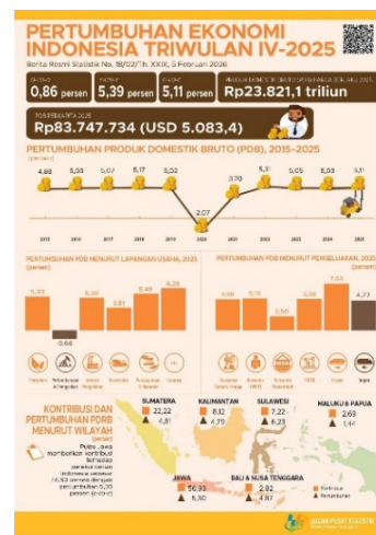
Gambar 1 Pertumbuhan perekonomian Indonesia triwulan 2025

Informasi ini kami dapatkan melalui website badan pusat statistik Indonesia yang membahas mengenai, Ekonomi Indonesia tahun 2025 tumbuh 5,11 persen.