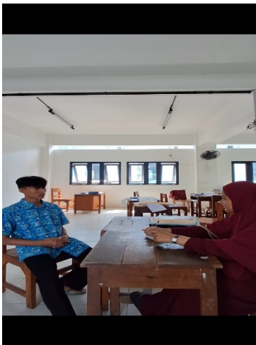
Gambar 2. Wawancara Dengan Santri Kelas XI

mendapatkan ilmu secara langsung, tetapi juga merasakan keteladanan akhlak dan sikap hidup para ulama karena bertatap muka dengan ulama yang memiliki kedalaman ilmu dan keluasan wawasan menjadi inspirasi tersendiri. Santri terdorong untuk meneladani semangat belajar para ulama, sekaligus menyadari bahwa penguasaan bahasa Arab merupakan pintu masuk utama untuk menggali khazanah keilmuan Islam yang luas. Dalam pertemuan-pertemuan tersebut, santri tidak hanya mendengarkan penjelasan, tetapi juga dilatih untuk mengajukan pertanyaan, berdiskusi, dan berinteraksi dengan bahasa Arab fusha . Inilah pengalaman akademik sekaligus spiritual yang saling berpadu.