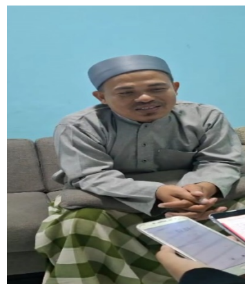
Gambar 3. Wawancara Dengan Ustadz

keseharian. Sementara itu, di Arabic Camp , penggunaan bahasa Arab telah menyatu dengan seluruh rangkaian kegiatan, mulai dari aspek akademik hingga ibadah. Hal ini mendorong santri untuk belajar secara lebih alami, cepat, dan menguasai bahasa dengan cara yang lebih efisien. Dengan demikian, pengalaman di Arabic Camp memberikan kesempatan belajar yang lebih intensif dan efektif dibandingkan dengan pembelajaran di pondok pesantren tradisional.