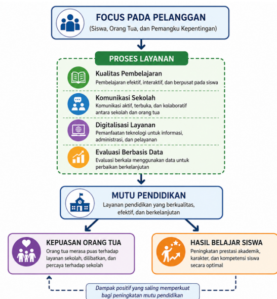
Gambar 2. Model Empiris Peningkatan Mutu Pendidikan

Pendekatan yang bersifat kolaboratif dan berbasis data menjadi kunci dalam memastikan keberlanjutan peningkatan mutu pendidikan.