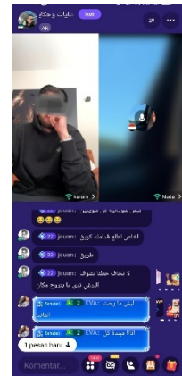
Gambar 4 Fitur live

Selain dua fitur yang telah disebutkan, pembelajar juga menggunakan fitur chat pribadi untuk berkomunikasi dengan lebih intens dengan pengguna lain. Namun, fitur ini relatif jarang digunakan dalam konteks meningkatkan kemampuan berbicara karena seringkali percakapan yang terjadi justru keluar dari tujuan pembelajar dan mengarah pada obrolan yang kurang relevan.