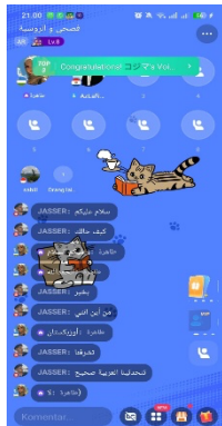
Gambar 1 Fitur obrolan dalam voiceroom