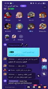
Gambar 2 Fitur voiceroom