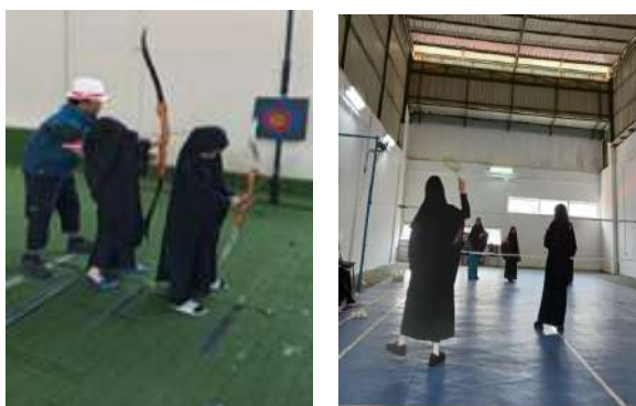
Gambar 8. Kegiatan Olahraga Panahan dan Badminton

Sebagai penutup, dapat ditegaskan bahwa pengembangan kurikulum di sekolah berbasis agama Islam harus berlandaskan Al-Qur'an dan As-Sunnah dengan pemahaman as-salaf agar mampu menjawab kebutuhan masyarakat sekaligus melahirkan generasi yang unggul. Kurikulum yang dirancang dengan orientasi pada aqidah, syariah, serta akhlak dan adab, kemudian diimplementasikan secara konsisten melalui manajemen pendidikan yang efektif, tenaga pendidik yang kompeten, serta evaluasi berkelanjutan, akan menghasilkan lulusan yang berkualitas. Hal ini sejalan dengan firman Allah Subhanahu wa Ta'ala: "Dan katakanlah: bekerjalah kamu, maka Allah akan melihat pekerjaanmu, begitu juga Rasul-Nya dan orang-orang mukmin..." (QS. At-Taubah: 105), serta sabda Rasulullah Shalallahu Alaihi Wasallam: "Sesungguhnya aku diutus untuk menyempurnakan akhlak yang mulia." (HR. Ahmad).