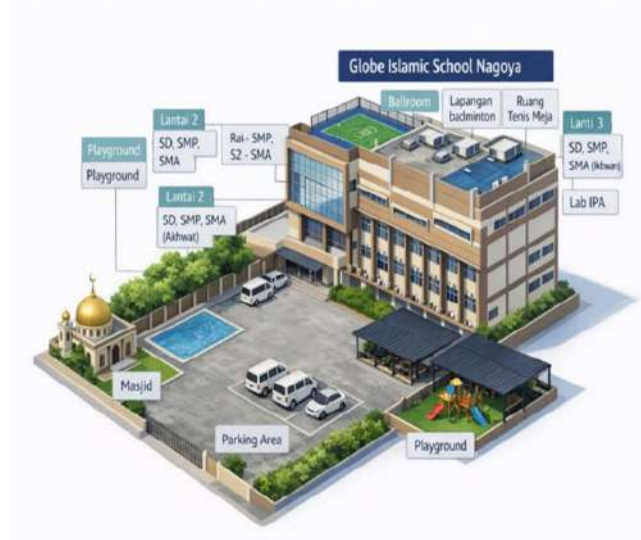
Gambar 3. Denah visual Globe Islamic School