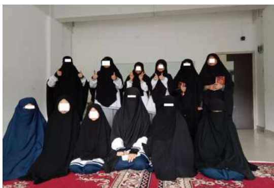
Gambar 7. Kegiatan Keagamaan Tahta (Tahfidz dan Tahsin)