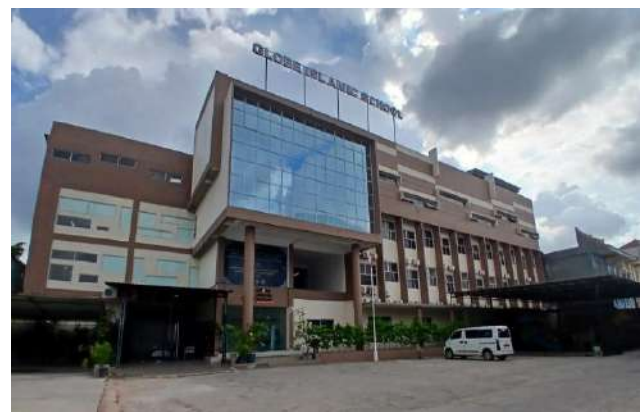
Gambar 2. Gedung Globe Islamic School