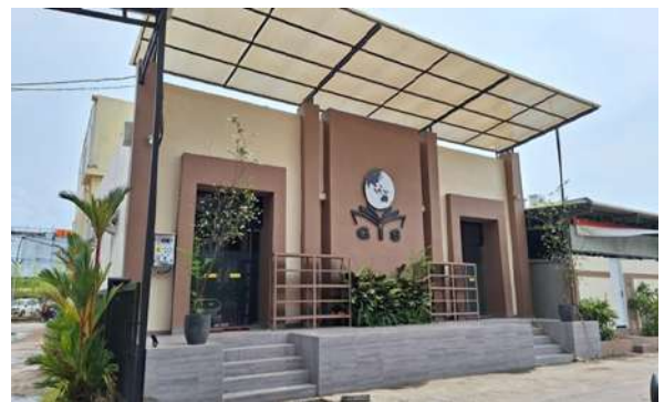
Gambar 4. Tempat Ibadah Masjid GIS (Ikhwan)

dan aktivitas sosial menumbuhkan kepedulian serta tanggung jawab terhadap masyarakat. Dengan demikian, kurikulum GIS Batam tidak hanya menghasilkan siswa yang cerdas secara intelektual, tetapi juga tangguh secara fisik, kreatif, dan memiliki sensitivitas sosial.