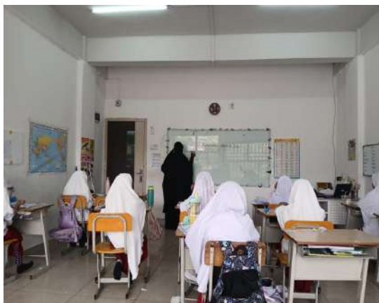
Gambar 6. KBM SD