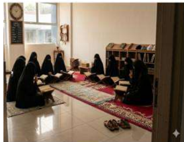
Gambar 5. Tempat Ibadah Mushola (Akhwat)