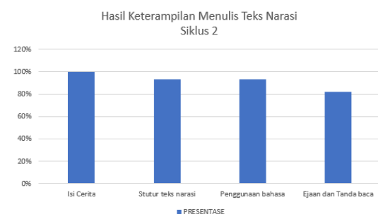
Grafik 1 Penilaian Keterampilan berbicara siklus II

Pada aspek pengetahuan, nilai rata-rata siswa meningkat menjadi 86 (kategori B). Hal ini menunjukkan bahwa pemahaman siswa terhadap teks narasi sudah berada pada kategori baik.