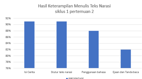
Grafik 1 Penilaian Keterampilan menulis siklus I pertemuan 2

Aktivitas siswa juga meningkat menjadi 88,8% (kategori baik), yang menunjukkan bahwa siswa mulai terbiasa dengan pembelajaran kontekstual dan lebih aktif dalam kegiatan belajar. Pada aspek pengetahuan, nilai rata-rata siswa meningkat menjadi 80 (kategori C), yang menunjukkan adanya peningkatan pemahaman terhadap materi teks narasi.