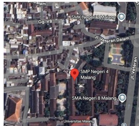
Gambar 1. Peta lokasi udara SMP Negeri 4 Kota Malang

dengan bukaan utama jendela menghadap ke arah selatan.