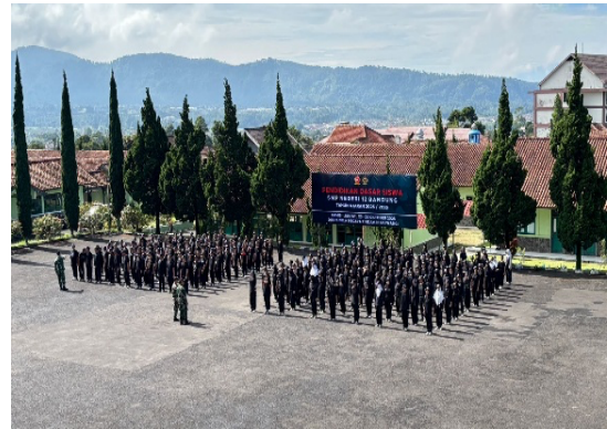
Gambar 1. Kegiatan Bela Negara SMPN 12 Bandung

Dalam konteks ini, Soekarno menegaskan bahwa kekuatan bangsa terletak pada karakter dan jiwa nasionalisme warganya. Dalam perkembangannya, konsep tersebut dipertegas dalam kajian Pendidikan Bela Negara yang menyatakan bahwa penanaman nilai cinta tanah air dilakukan melalui proses pendidikan yang bersifat edukatif, partisipatif, dan berkelanjutan, sehingga nilai tersebut tidak hanya dipahami secara kognitif tetapi juga terwujud dalam sikap dan perilaku siswa.