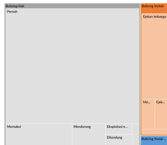
Gambar 3 Hierarchy Tree Map Perilaku Bullying

bullying . Berikut adalah hasil visualisasi dari bentuk-bentuk perilaku bullying dengan Hierarchy Tree Map