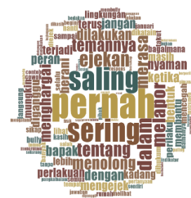
Gambar 1 Hasil Visualisasi Word Cloud bentuk-bentuk bullying

Studi ini diterapkan di SD Negeri 14 Pangkalpinang pada bulan Januari sampai bulan Februari Tahun 2026. Studi ini bertujuan untuk mengkaji berbagai jenis bullying serta peran yang dimainkan oleh guru kelas dalam mengurangi bullying di kalangan siswa SD Negeri 14 Pangkalpinang. Hasil analisis mengenai peran guru kelas dalam mencegah bullying di kalangan siswa SD Negeri 14 Pangkalpinang diuraikan dalam makalah ini. Berikut yakni visualisasi word cloud dari hasil analisis bentuk-bentuk bullying pada siswa.