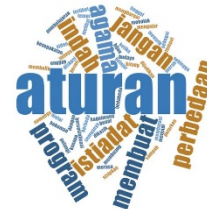
Gambar 2 Hasil Visualisasi Word Cloud peran guru kelas

visualisasi dalam bentuk word cloud Peran Guru: