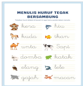
Gambar 2. Halaman Kedua LKPD