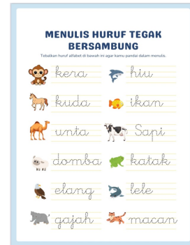
Gambar 4. Tampilan LKPD Setelah Di Kembangkan

Berdasarkan perbandingan isi dan tampilan antara lembar kerja peserta didik (LKPD) pada gambar pertama dan buku paket/lembar latihan pada gambar kedua, dapat disimpulkan bahwa keduanya memiliki tujuan pembelajaran yang sama, yaitu melatih keterampilan menulis huruf tegak bersambung, namun disajikan dengan pendekatan yang berbeda. Lembar kerja peserta didik pada gambar pertama dirancang dengan pendekatan tematik dan visual yang menarik, menggunakan gambar serta warna untuk membantu peserta didik mengenal kosa kata sekaligus melatih kemampuan menulis. Tampilan yang ceria dan penggunaan