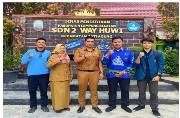
Gambar 1 Foto Bersama Aparatus Sekolah

Pelaksanaan kegiatan ini didukung oleh mahasiswa KKN Universitas Lampung Tahun 2026 sebagai fasilitator dan pendamping. Mereka membantu dalam diskusi, pengelolaan kelompok, serta memudahkan siswa memahami materi, sehingga suasana belajar menjadi lebih interaktif dan nyaman. Kegiatan ini dimulai dengan penyuluhan interaktif tentang literasi