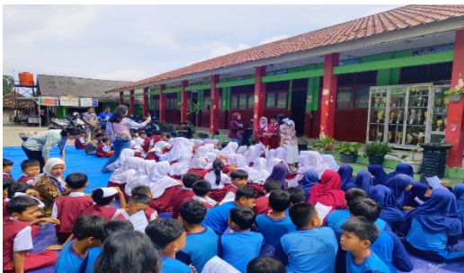
Gambar 2 Penyampaian Materi Literasi Digital

Setelah penyuluhan, kegiatan dilanjutkan dengan diskusi kelompok berbasis studi kasus, di mana siswa menganalisis perilaku di media sosial seperti hoaks, komentar tidak santun, dan perundungan siber, lalu mengaitkannya dengan nilai-nilai Pancasila. Selanjutnya, siswa mengikuti simulasi komunikasi digital