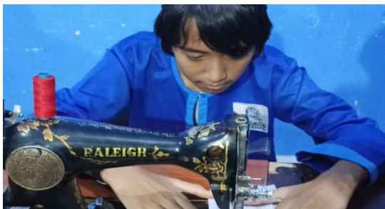
Gambar 2. SALAH SATU KEGIATAN VOKASIONAL

Semua anak di Indonesia tanpa terkecuali berhak atas pendidikan termasuk bagi anak berkebutuhan khusus (ABK) . pendidikan formal seperti sekolah memfasilitasi anak mendapatkan pelajaran bidang akademik seperti ilmu pengetahuan , dan ada juga bidang non akademik untuk mengembangkan kreativitas dan ketrampilan . ada berbagai bidang non akademik yang dapat diajarkan pada anak berkebutuhan khusus , yakni pendidikan vokasional. Ketrampilan vokasional adalah suatu proses pengetahuan yang menitik beratkan kepada teori dan praktik yang berhubungan dengan model , prinsip dan prosedur dalam mengerjakan suatu kejuruan dimana peserta didik dibekali dengan kecakapan personal, sosial, intelektual serta profesionalitas untuk nantinya diterapkan didunia kerja (jaya et al., 2018).