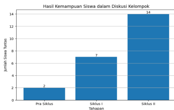
Diagram batang hasil belajar peserta didik Pembahasan

Penelitian ini merupakan penelitian tindakan kelas (PTK) yang bertujuan untuk meningkatkan hasil belajar siswa melalui penerapan metode diskusi kelompok pada siswa kelas VIII di MTs Darussalam Al-Hafidz Jambi. Adapun materi yang dibahas dalam proses pembelajaran meliputi sikap tawadhu”, husnuzan, dan ghadab. Ketiga materi ini