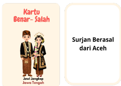
Gambar 4. Kartu Benar-Salah