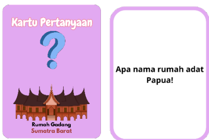
Gambar 3. Kartu Pertanyaan