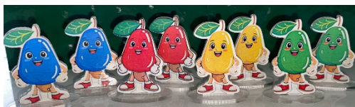
Gambar 6. Pion