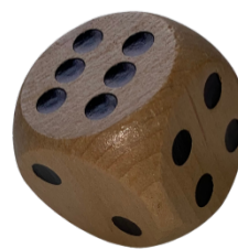
Gambar 7. Dadu