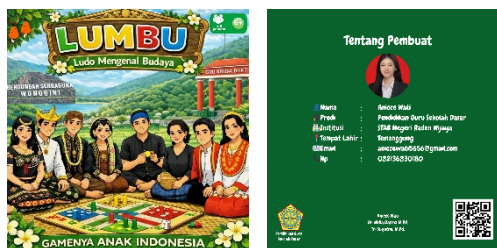
Gambar 8. Box Lumbu