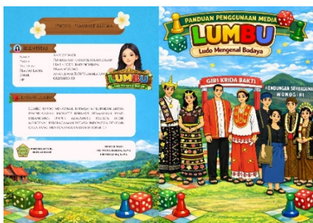
Gambar 2. Buku Panduan