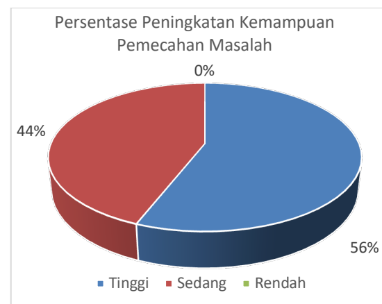
Gambar 1. Persentase Peningkatan Kemampuan Pemecahan Masalah

Hal ini mengindikasikan bahwa pembelajaran berbasis masalah mampu mendorong peserta didik untuk berpikir aktif, kritis, dan analitis. Jika ditinjau dari kategori peningkatan berdasarkan nilai N-gain, sebagian besar peserta didik berada pada kategori tinggi. Secara lebih rinci, sebanyak 14 peserta didik berada pada kategori tinggi, sedangkan 11 berada pada kategori sedang. Hal ini menunjukkan bahwa penerapan model PBL berbantuan LiveWorksheet memberikan dampak positif terhadap peningkatan kemampuan pemecahan masalah peserta didik. Persentase peningkatan hasil pretest dan posttest peserta didik kelas VIII-D disajikan pada Gambar 1. berikut.