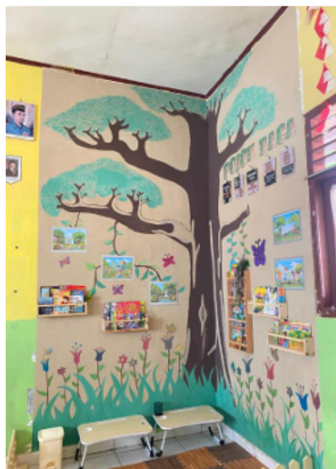
Gambar 1. Hasil dari Pojok Literasi

Hasil dokumentasi menunjukkan adanya perubahan kondisi lingkungan belajar yang lebih mendukung kegiatan literasi. Setelah pengembangan, terlihat adanya pojok literasi yang rapi, menarik, dan mudah diakses oleh siswa. Dokumentasi tersebut menjadi bukti visual bahwa pojok literasi telah diimplementasikan sesuai dengan rencana dan digunakan secara optimal oleh siswa dan guru.