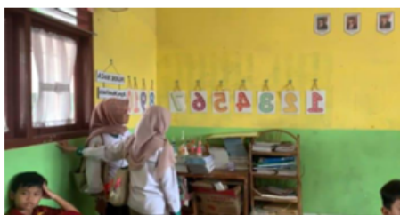
Gambar 2. Kondisi Awal Kelas Sebelum Pengembangan Pojok Literasi