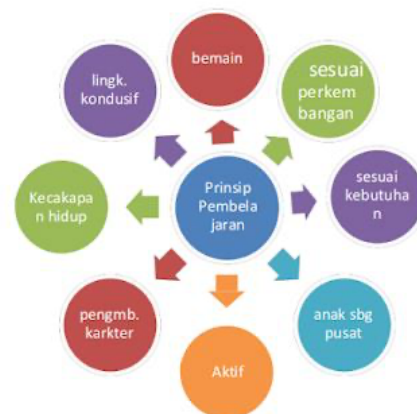
Gambar 1. Diagram Penerapan Prinsip Pembelajaran