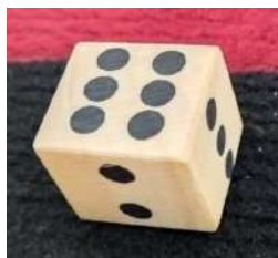
Gambar 6. Dadu