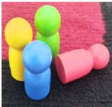
Gambar 5. Pion