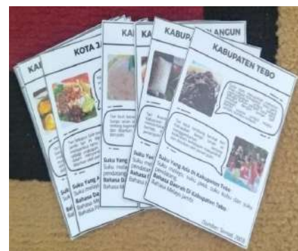
Gambar 2. Kartu Kabupaten