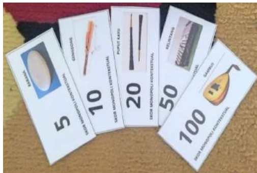
Gambar 4. Kartu Skor