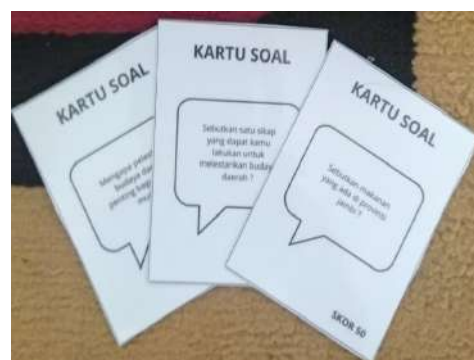
Gambar 3. Kartu Soal