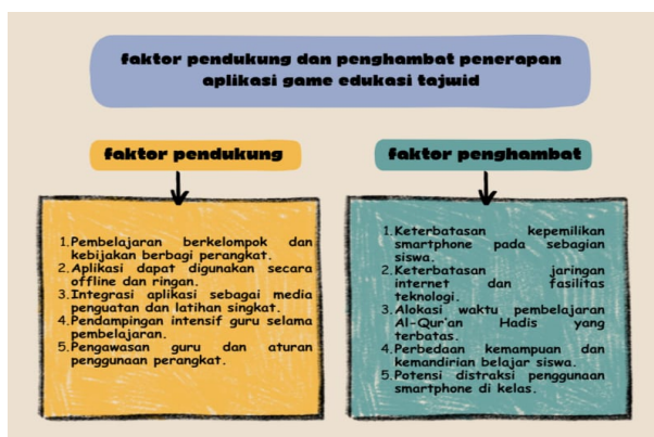
Gambar 1.2 faktor pendukung dan penghambat madrasah ibtidaiyah darussalam

Oleh karena itu, identifikasi terhadap berbagai faktor tersebut diperlukan untuk memahami tingkat keberhasilan implementasi aplikasi sebagai media pembelajaran tajwid. Beberapa faktor pendukung dan penghambat penerapan aplikasi game edukasi tajwid di madrasah ibtidaiyah darussalam dapat dilihat pada gambar dibawah ini: