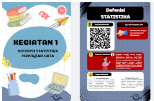
Gambar 2 Tampilan Isi Materi

dalam penyajian materi melalui aktivitas yang melibatkan aspek sains, teknologi, teknik, seni, dan matematika.