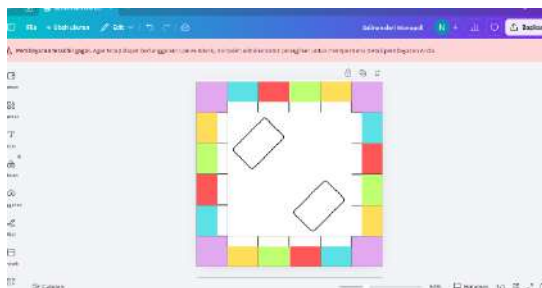
Gambar 1. Pembuatan Kerangka Awal Papan Monopoli

menambahkan daya tarik (Raudhatul Jannah, 2023). Tahap awal dalam proses pembuatan media yaitu mendesain papan monopoli sesuai materi yang akan dimuat, menentukan warna yang sesuai, mencari gambar yang sesuai dengan materi, membuat kartu soal, membuat kartu keberuntungan, dadu, dan pion yang akan melengkapi media monopoli yang akan dikembangkan.