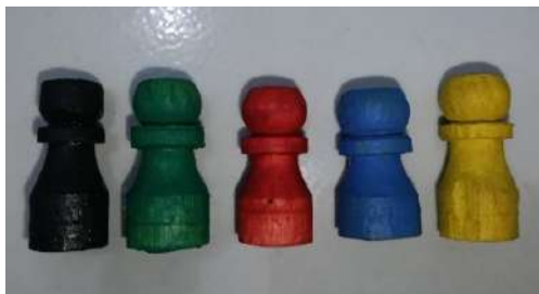
Gambar 5. Pion dan Dadu

Petunjuk penggunaan berisi langkah-langkah cara bermain media monopoli dimulai dari awal hingga akhir.