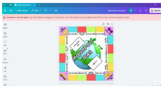
Gambar 2. Penambahan Nama dan Gambar

Kerangka papan monopoli berukuran 36cm x 36cm tersusun dari beberapa petak yang berjumlah 20 petak.