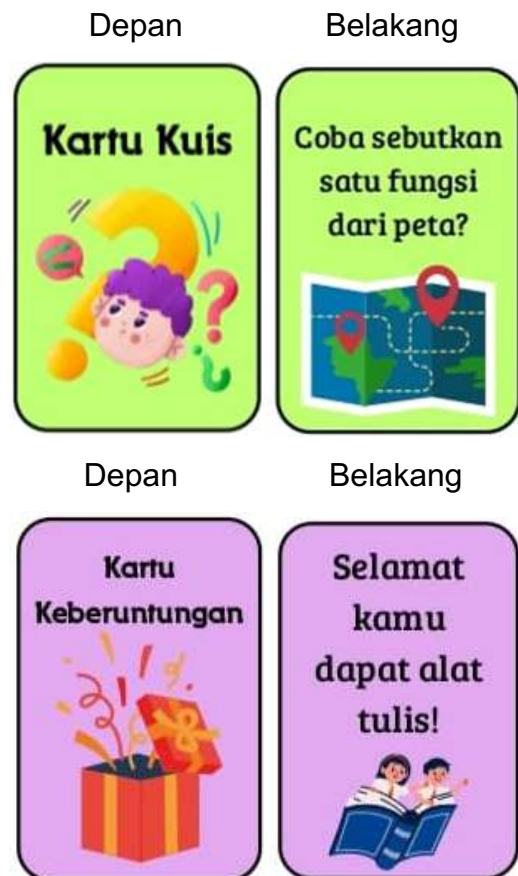
Gambar 3. Desain Kartu Kuis dan Kartu Keberuntungan

Selanjutnya kerangka papan monopoli akan diberikan nama-nama pada petak-petak monopoli yang terdiri dari petak start, 10 petak kartu kuis, 9 petak kartu keberuntungan.