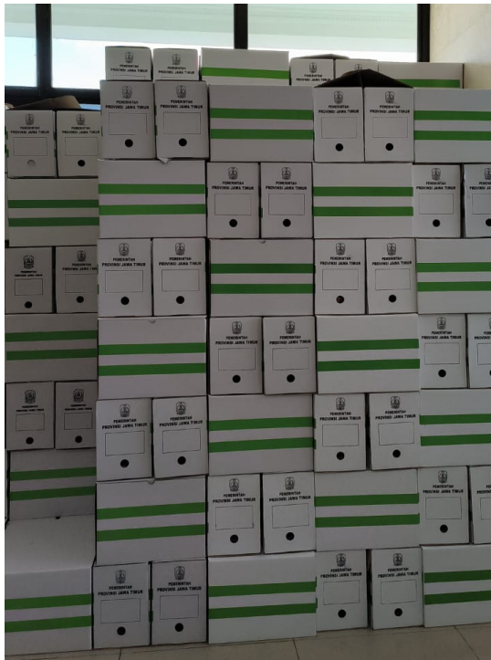
Gambar 4 Boks Penyimpanan Arsip