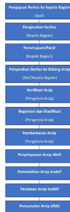
Gambar 1 Alur Penyimpanan Arsip

Tahap pengajuan berkas menjadi langkah awal yang sangat penting dalam keseluruhan proses pengelolaan arsip. Pada tahap ini, staf menyerahkan berkas kegiatan, laporan administrasi,