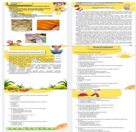
Gambar 5. Halaman soal

Pada halaman ini terdapat beberapa soal yang dapat menumbuhkan semangat berpikir kreatif peserta didik dalam memahami teks prosedur secara konkret. Pembuatan halaman soal dilakukan dengan memanfaatkan fitur teks dan elemen pada platform Canva, serta penambahan gambar animasi agar halaman lebih menarik saat dilihat. Kemudian peneliti menyusun beberapa soal yang dimulai dari memahami setiap gambar makanan khas yang disajikan melalui teks prosedur, serta cerita pendek dari materi “Ekspresikan dirimu melalui