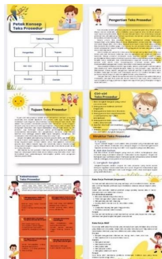
Gambar 4. Halaman materi

Pada halaman materi, terdapat berbagai pembahasan tentang teks prosedur, di mulai dari pengertian teks prosedur, tujuan teks prosedur, peta konsep teks prosedur, ciri-ciri teks prosedur, struktur teks prosedur, kaidah kebahasaan teks prosedur, jenis-jenis teks prosedur, langkah-langkah membuat teks prosedur, serta pengintegrasian teks prosedur yang memuat contoh-contoh teks prosedur berdasarkan kearifan lokal pidie. Pembuatan halaman-halaman ini dilakukan dengan memanfaatkan fitur teks, elemen, gambar, dan berbagai animasi pada platform Canva, selain itu penambahan ilustrasi, elemen