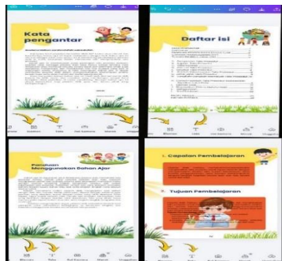
Gambar 3. Halaman pembuka

Pada halaman selanjutnya sebelum menuju ke halaman materi, terdapat beberapa halaman diantaranya halaman kata pengantar, Daftar isi, Panduan menggunakan bahan ajar, Capaian Pembelajaran (CP) dan Tujuan Pembelajaran (TP). Proses pembuatan beberapa halaman ini dilakukan dengan memanfaatkan fitur teks, elemen, gambar, dan animasi pada platform Canva. Peneliti memilih desain, warna yang sesuai agar halaman pembuka terlihat menarik dan informatif. Penyajian komponen awal bahan ajar yang sistematis ini penting karena dapat membantu peserta didik memahami alur penggunaan bahan ajar serta tujuan pembelajaran yang ingin dicapai. Tampilan yang menarik juga dapat meningkatkan minat belajar peserta didik sejak awal pembelajaran, sehingga mereka lebih