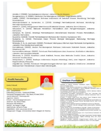
Gambar 6. Halaman penutup

Pada halaman-halaman ini, terdapat rangkuman dari pembahasan bahan ajar, daftar pustaka, dan profil penulis. Perancangan ini dilakukan dengan dengan memanfaatkan fitur-elemen dan teks untuk menghasilkan jenis huruf yang sesuai dengan desain bahan ajar.