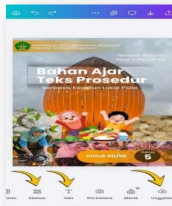
Gambar 2. Cover Bahan Ajar

Pada sampul cover terdapat judul materi dari bahan ajar, kelas, nama penulis, serta simbol universitas. Tampilan sampul gambar pada elemen-elemen yang disajikan juga menggunakan kearifan lokal pidie dengan berbagai unggahan gambar makanan, adat istiadat serta ikon tugu aneuk mulieng sebagai representasi identitas lokal daerah Pidie. Selanjutnya pemilihn warna serta tampilan keseluruhan desain cover disusun dengan fitur-fitur terbaru yang menggunakan teks, elemen, serta gambar, yang ada di platfrom Canva. Serta mempertimbangkan aspek komposisi warna, dan penggunaan elemen grafis yang menarik.