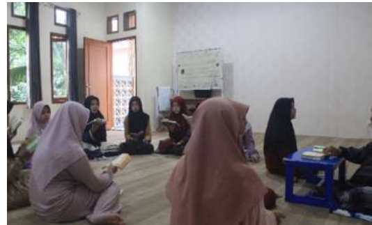
Gambar 3 Prosesi talqin di majlis 2

melalui teguran dan pemberian contoh pelafalan yang tepat.