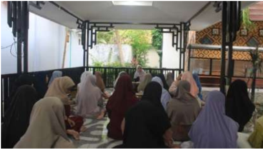
Gambar 5: Implementasi metode talaqqi

memperkuat proses internalisasi hafalan secara kognitif.