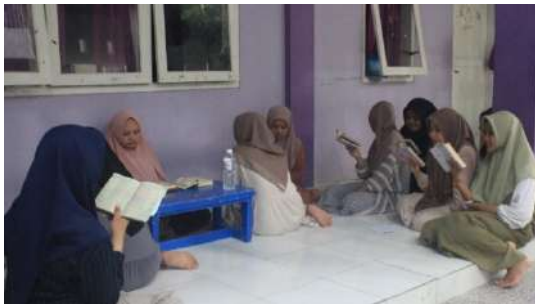
Gambar 4: Prosesi setoran bil ghaib dan menghafal Qur'an

menghafal Al-Qur'an santri. Melalui pembiasaan membaca Al-Qur'an secara langsung di hadapan asatidz, santri mampu memperbaiki ketepatan bacaan sehingga kesalahan tajwid dan makharijul huruf dapat diminimalkan secara bertahap.