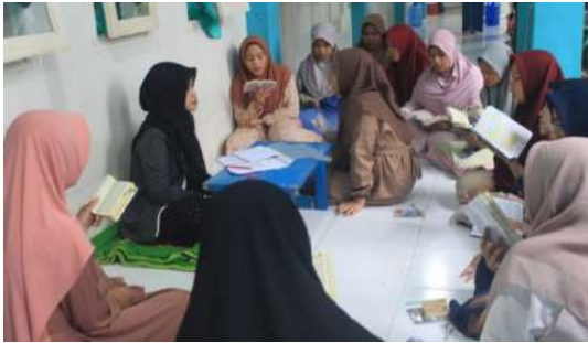
Gambar 1: Prosesi metode Talaqqi di majlis 1

Hasil penelitian menunjukkan bahwa implementasi metode talaqqi di Tahfizh Al-Mawaddah menempatkan interaksi langsung antara santri dan asatidz sebagai pusat pembelajaran.