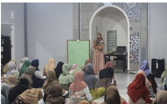
Gambar 2 Pembelajaran tajwid

Prosesi metode Talaqqi di majlis 1, menunjukkan interaksi tatap muka antara santri dan asatidz. Asatidz membimbing santri dalam membaca dan mengulang ayat-ayat Al-Qur'an serta memastikan ketepatan bacaan sesuai kaidah tajwid dan makharijul huruf.