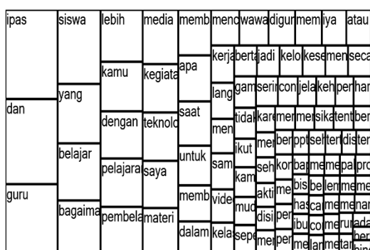
Gambar 3. Treemap perbandingan jawaban siswa yang paling sering muncul

Kemunculan kata guru yang tetap dominan dalam Treemap menunjukkan bahwa siswa masih memposisikan guru sebagai fasilitator utama dalam pembelajaran, meskipun teknologi digunakan secara aktif. Hal ini menegaskan bahwa teknologi tidak menggantikan peran guru, melainkan memperkuat fungsi pedagogisnya dalam menjelaskan, mengarahkan diskusi, dan memperjelas konsep. Dengan demikian, visualisasi Treemap memperlihatkan adanya keseimbangan antara peran teknologi dan peran guru dalam membangun pemahaman siswa.