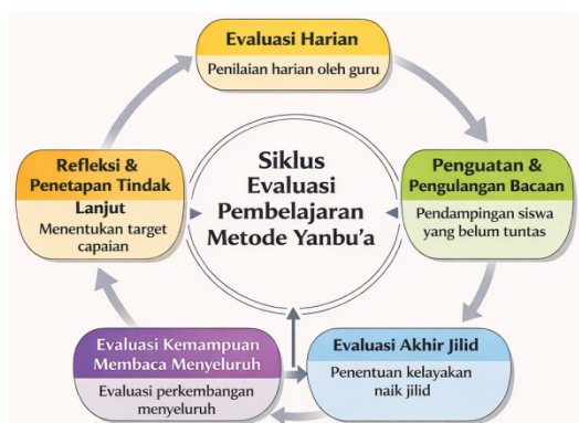
Gambar 2 Siklus Evaluasi Pembelajaran Metode Yanbu'a

Gambar 2 menunjukkan bahwa evaluasi pembelajaran metode Yanbu'a dilakukan secara berjenjang dan berkelanjutan. Evaluasi harian menjadi dasar pemberian penguatan dan pengulangan bacaan bagi siswa yang belum tuntas, yang selanjutnya dilanjutkan dengan evaluasi akhir jilid dan evaluasi kemampuan membaca Al-Qur'an secara menyeluruh. Hasil evaluasi tersebut menjadi dasar refleksi dan penetapan tindak lanjut pembelajaran, sehingga proses evaluasi berfungsi tidak hanya sebagai penilaian hasil, tetapi juga sebagai alat penguatan pembelajaran.