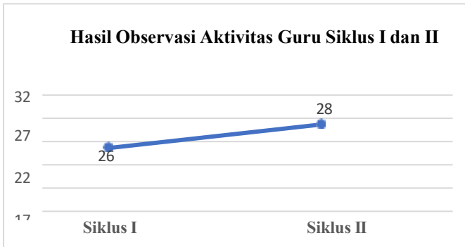
Gambar 1. Grafik Hasil Observasi Aktivitas Guru Siklus I

Perbandingan aktivitas peserta didik pada materi pecahan senilai dengan model Problem Based Learning (PBL) di kelas VI SDN Handil Bakti Barito Kuala pada siklus I dan siklus II dapat dilihat pada tabel berikut: