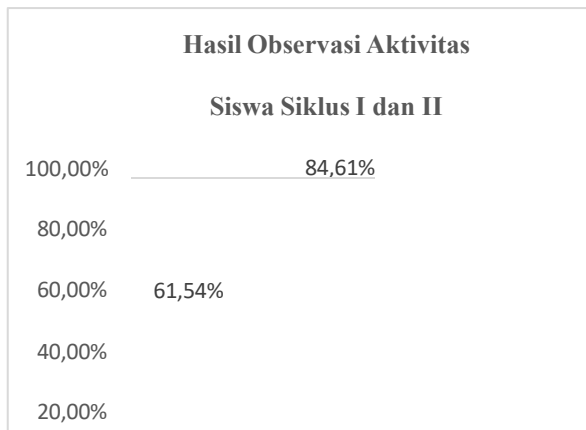
Gambar 2. Grafik Hasil Observasi Aktivitas Peserta didik Siklus I dan Siklus II

Hasil belajar peserta didik pada materi pecahan senilai memperlihatkan kenaikan yang signifikan setelah model Problem Based Learning (PBL) diterapkan. Pada siklus I, persentase peserta didik yang mencapai ketuntasan belajar hanya sebesar 58,33%, angka yang belum memenuhi target keberhasilan klasikal sebesar minimal 80%.