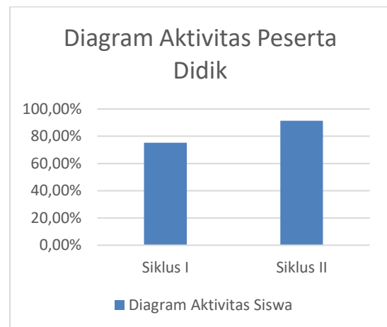
Diagram 2. Aktivitas Peserta Didik

Adapun faktor yang mendukung adanya peningkatan dalam aktivitas peserta didik adalah proses pembelajaran sudah terlaksana berdasarkan modul ajar yang telah disusun dan guru selalu melakukan refleksi pada setiap siklus.