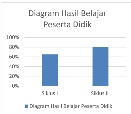
Diagram 3. Hasil Belajar Peserta Didik

individual dilihat dari KKTP yang telah ditetapkan di SD Negeri 45 Banda Aceh yaitu 75%. Pada siklus I hasil belajar peserta didik mencapai 65% dengan jumlah 13 siswa tuntas dan 7 tidak tuntas. Dan pada siklus II hasil belajar peserta didik mengalami peningkatan yaitu mencapai 80% dengan 16 siswa tuntas dan 4 siswa tuntas.