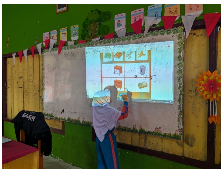
Gambar 2 Uji Coba Kelompok Besar

Pada Angket Respons peserta didik difokuskan pada ketertarikan, kemudahan bermain, dan kesenangan dalam mengikuti pembelajaran menggunakan game edukatif. Hasil menunjukkan skor rata-rata 4,06 dengan kategori sangat praktis. Peserta didik terlihat antusias, aktif, dan mampu menyelesaikan setiap level permainan secara bertahap sesuai indikator kemampuan berpikir logis.