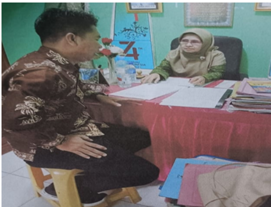
Gambar 3 Kegiatan Umpan Balik

berbasis digital, lebih percaya diri dalam menggunakan platform pembelajaran digital, serta lebih reflektif dalam mengevaluasi proses pembelajaran yang telah dilaksanakan. Hal ini berdampak pada meningkatnya keterlibatan peserta didik dalam pembelajaran dan terciptanya suasana belajar yang lebih aktif dan interaktif.