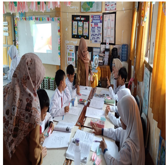
Gambar 1 Obervasi Kelas Oleh Supervisor

setelah kegiatan pembelajaran berlangsung. Pendekatan ini menunjukkan bahwa supervisi akademik di SDN 001/V Kuala Tungkal bersifat pembinaan dan kolaboratif, bukan sekadar pengawasan administrative.