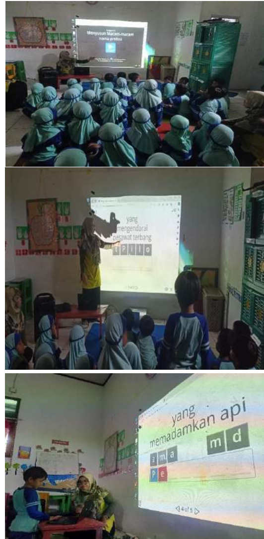
Gambar 1 Pembelajaran Wordwall

Untuk gambar dan grafik keterangan ditampilkan di bawah grafik atau gambar tersebut dengan spasi 1. Untuk lebih memperjelasnya adalah sebagai berikut.