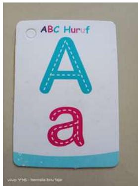
Gambar 1 Media Gambar

Hasil penelitian ini menguatkan dugaan awal bahwa media gambar dapat menjadi strategi pembelajaran yang efektif untuk meningkatkan kemampuan membaca permulaan siswa di kelas satu. Peningkatan kemampuan membaca permulaan pada kelompok eksperimen menunjukkan bahwa media gambar memiliki peran penting dalam membantu siswa memahami materi membaca dengan cara yang lebih konkret dan menarik. Media visual membantu siswa mengingat dan memahami hubungan antara huruf, suku kata, dan kata.