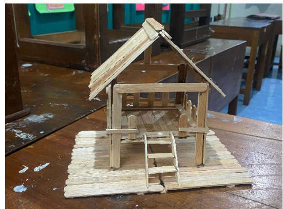
(Karya 4 : pajangan rumah dari stik es krim)