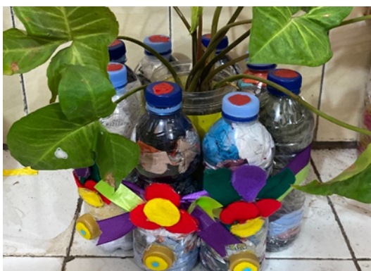
(Karya 5 : pot bunga dari ecobrick)

Evaluasi Produk : Manfaat program terlihat dari peningkatan kreativitas, tanggung jawab, dan antusiasme siswa dalam kegiatan proyek. Siswa mampu bekerja sama, berpikir kritis, dan menghasilkan produk nyata. Siswa di kelas V sudah menunjukkan perubahan sikap yang dapat dilihat melalui observasi guru serta daftar nilai mingguan.