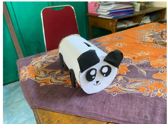
(Karya 3 : celengan dari kardus bekas)