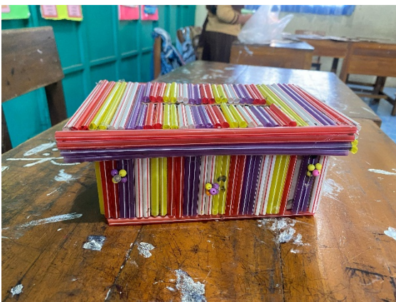
(Karya 1 : tempat tisu dari sedotan bekas)

Hasil karya tema gaya hidup berkelanjutan :