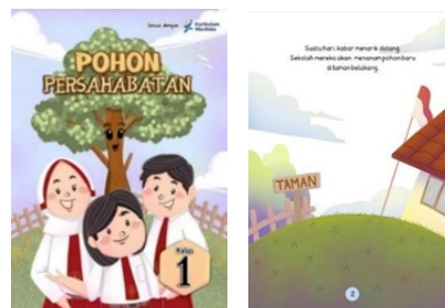
Gambar 2 Tampilan Buku Cerita Bergambar

Setelah menyelesaikan tahap design, kemudian dilanjutkan tahap