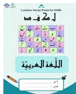
Gambar 1. Sampul Depan

Halaman depan memuat informasi berupa judul dan kolom identitas peserta didik. Judul yang dikembangkan ialah “ al lughoh al arabiyah” Dengan penulis hazmi auliyah.