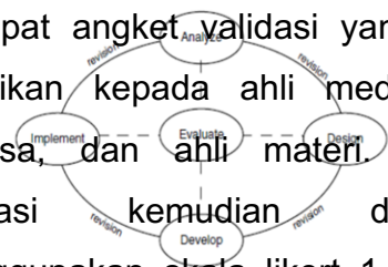
Gambar 1. Model pengembangan ADDIE (Branch, 2009:2)

Instrumen pengumpulan data yang digunakan dalam penelitian ini berupa tes yang diberikan kepada peserta didik kelas IV yang berjumlah 24 orang, angket respon guru dan siswa untuk kemudian dianalisis dengan menilai tingkat efektivitas dan kepraktisan media Sugam sebagai media pembelajaran. Selain itu, terdapat angket validasi yang akan diberikan kepada ahli media, ahli bahasa, dan ahli materi. Angket validasi kemudian dianalisis menggunakan skala likert 1-5 untuk menilai kelayakan media Sugam. Kelayakan media Sugam dihitung menggunakan rumus sebagai berikut: